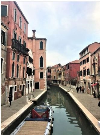
Venice, Italy Regaleira, Sintra, Portugal