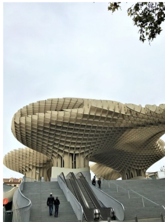
Metropol Parasol, Seville, Spain Quinta da