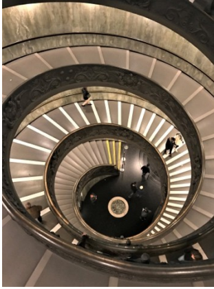
Spiral Staircase, Vatican Hamburg, Germany