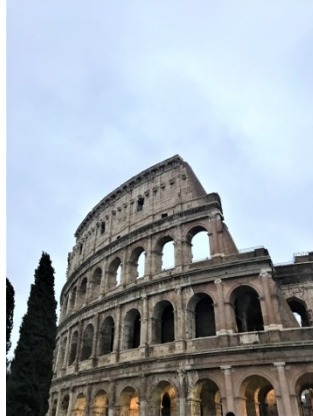
Collesseum, Rome, Italy