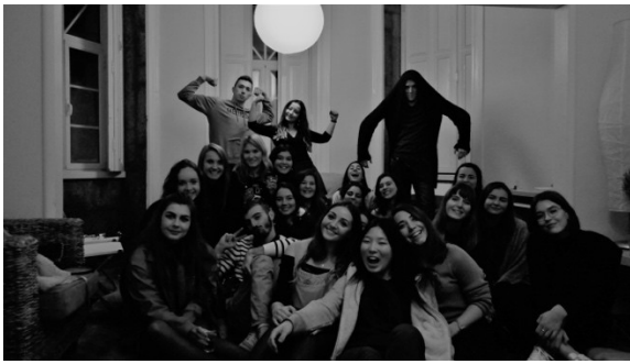
Castelo Branco, Portugal