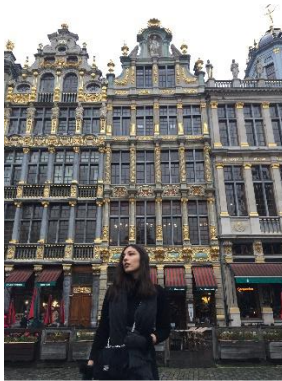
Grand Place, Brüssel