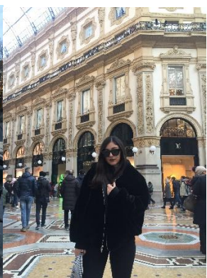
Galleria Vittorio Emanuele Milano