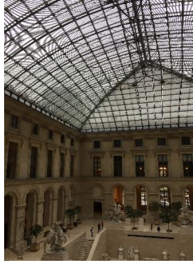
Louvre Museum, Paris