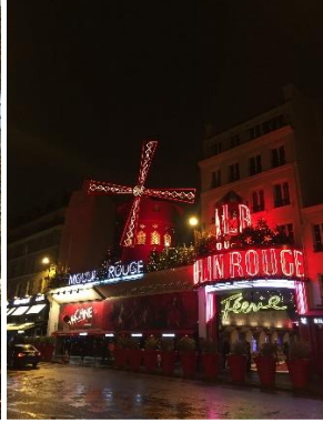
Moulin Rouge, Paris