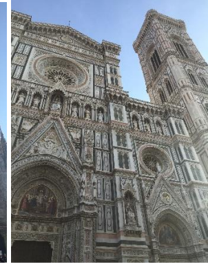
Santa Maria del Fiore, Floransa