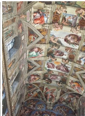
Vatican Museums, Roma