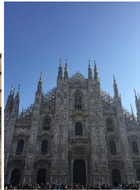
Duomo Meydani, Milano