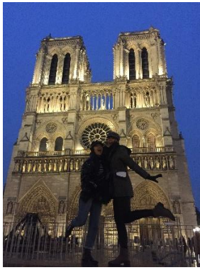
Notre Dame, Paris