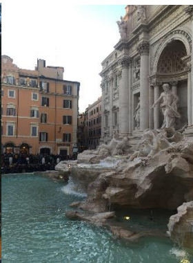
Fontana di Trevi, Roma