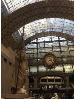
Musee d'Orsay, Paris