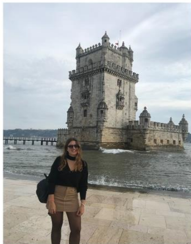
Belem Tower, Lizbon, Portugal