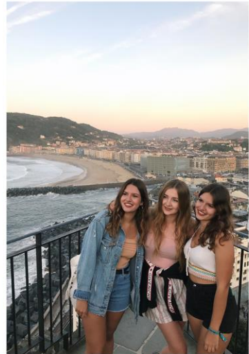
San Sebastian, Spain