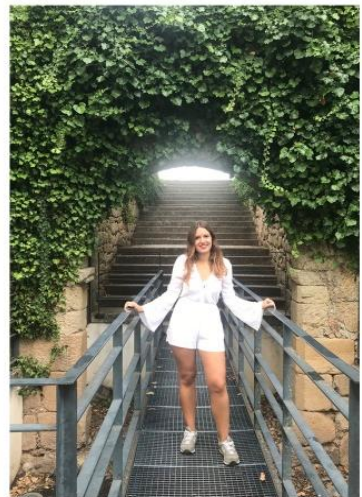
Castelo Branco, Portugal