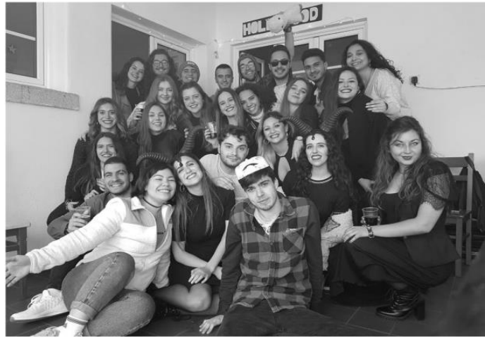
Castelo Branco, Portugal