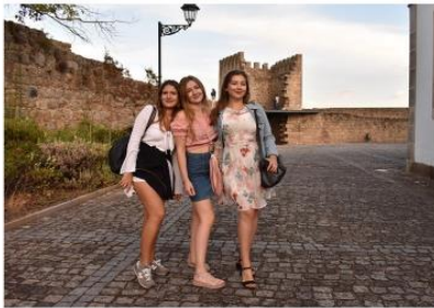
Castelo Branco, Portugal